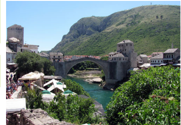
Brücke von Mostar

Telefon: 06154 694337 Telefax: 06154 694332 E-Mail: bildung@darmstadt-land-evangelisch.de Internet: www.darmstadt-land-evangelisch.de